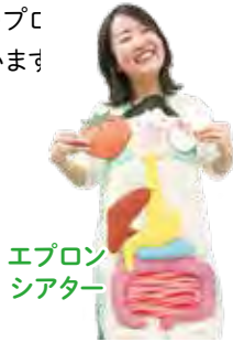
エプロンシアター