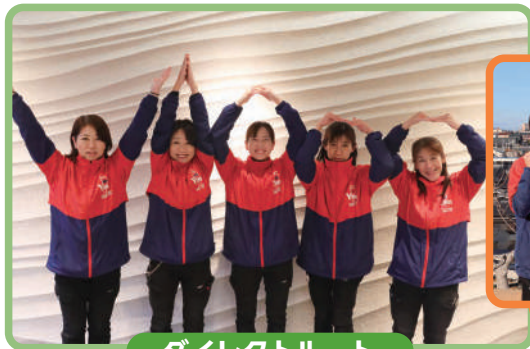
ダイレクトルート