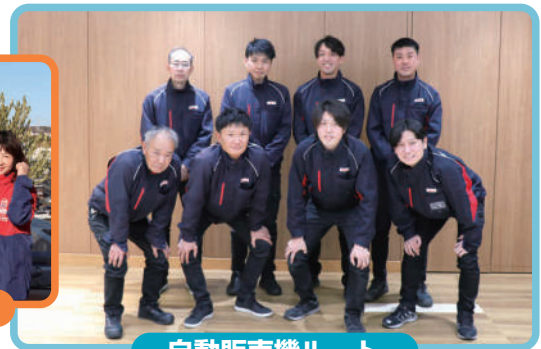
自動販売機ルート