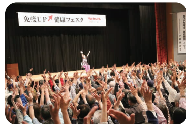
●チェアトレーニング